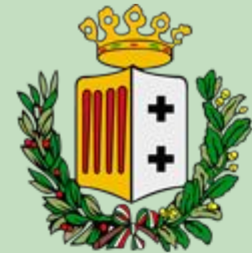
Città Metropolitana di Reggio Calabria