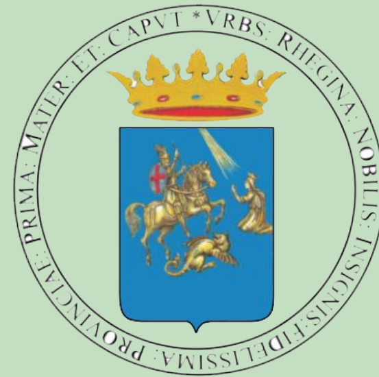
Città di Reggio Calabria

CNA COLDIRETTI CONFAGRICOLTURA CONFARTIGIANATO CONFCOMMERCIO CONFESERCENTI CONFINDUSTRIA COPAGRI