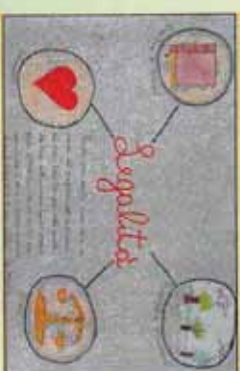
1° Premio ex-aequo Federica Postorino (O.Lazzarino, 2°E)