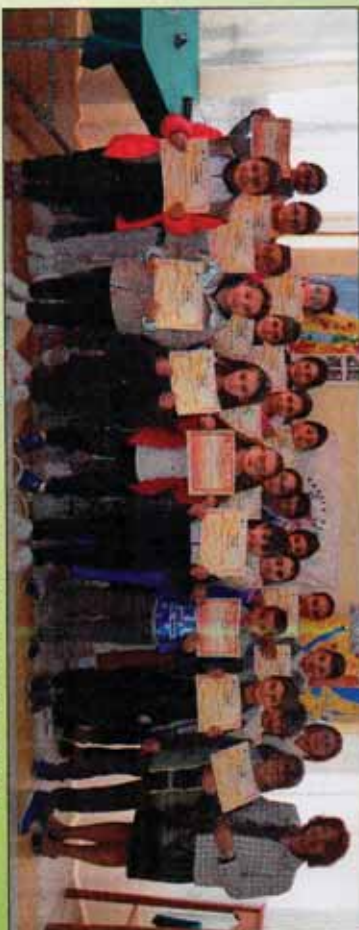
Foto di gruppo dei vincitori del concorso Scuole Elementare di Sambatelio