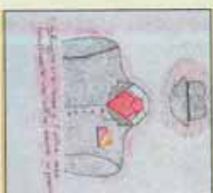
3° Premio Hilsa Missouli (O.Lazzarino, 2°E)