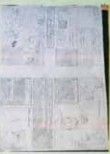
Tavola Rotonda - Premiata ed esaltata la Legalità