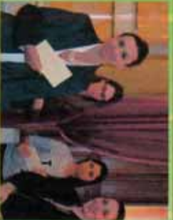
2° Premio Gabriela Malinace (2° E, Liceo Artistico "Priet-Frangipane")