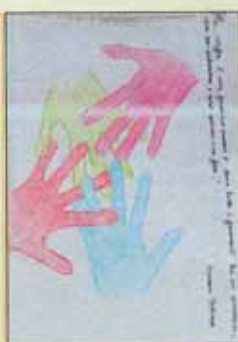
2° Premio Laura Fossato (O. Lazzarino, 3°E)