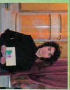
3° Premio Danni Lyudimirov Draginov (2° T, ITC "Einaudi" - Palmi)