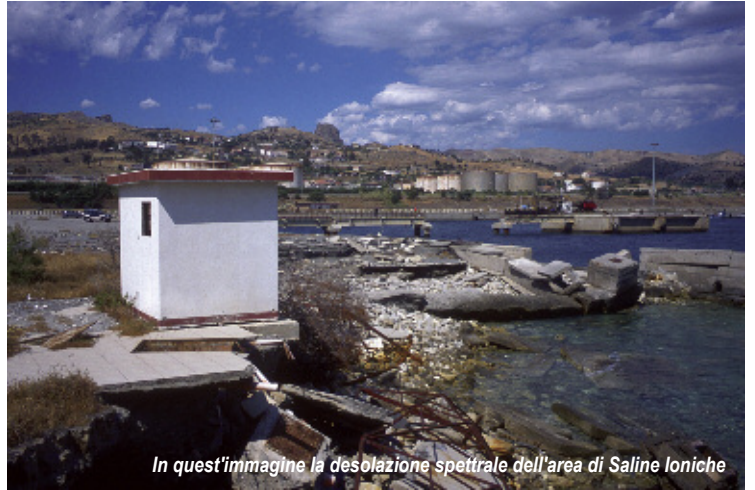
In quest'immagine la desolazione spettrale dell'area di Saline Ioniche